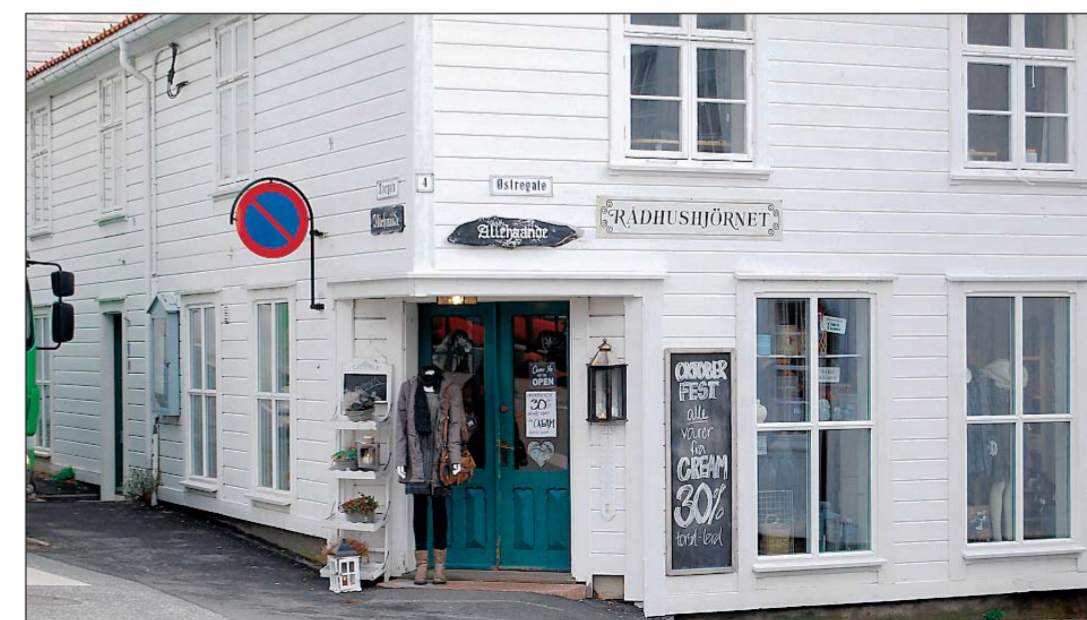
BUTIKK: Allehaande drives av Avigo.

● Flere næringsdrivende i Lillesand reagerer på butikkdriften til arbeidstreningsbedriften Avigo.